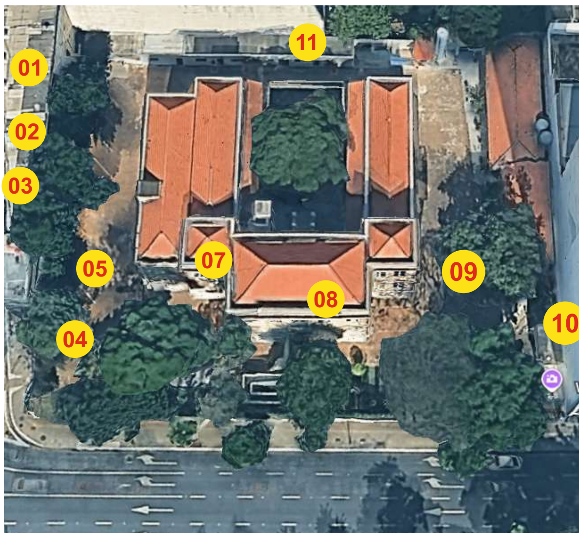
Foto aérea, Instituto Clemente Ferreira Podas